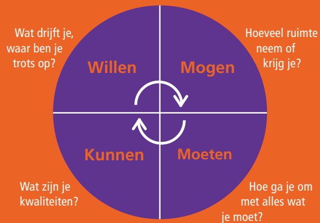
Cirkel van balans

Belangstelling? We komen graag langs voor een vrijblijvend, oriënterend gesprek.